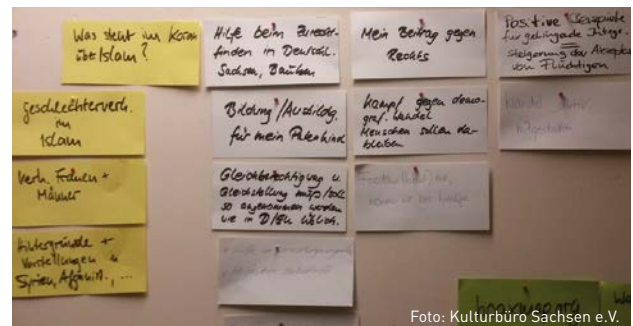
Impression vom Workshop

Alexandersbad ein „geschützter Raum“ geschaffen, in dem sich Polizist*innen und Akteur*innen der Zivilgesellschaft in insgesamt vier Veranstaltungen über kontroverse Positionen, die jeweiligen Selbst- und Fremdzuschreibungen und die daraus resultierenden Handlungsweisen austauschen können.