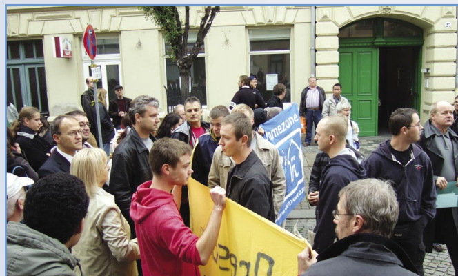
Rechtsextreme Wortergreifung am Rande des Bürgerfrühstücks der Bürgerinitiative Pieschen gegen Rechts am 6.10.2007.

men Szene zuzuordnen sind oder bereits in der Vergangenheit durch rassistische, nationalistische, antisemitische oder sonstige Menschen verachtende Äußerungen in Erscheinung getreten